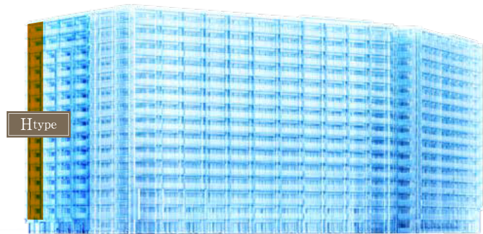
カームコート ブライトコート エアリーコート

バルコニー面積 / 16.83m 2 サービスバルコニー面積 / 2.30m 2